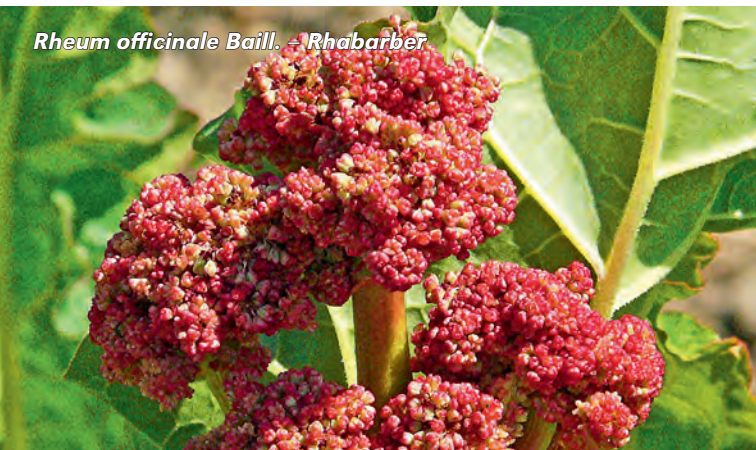
Rheum officinale Baill. – Rhabarber