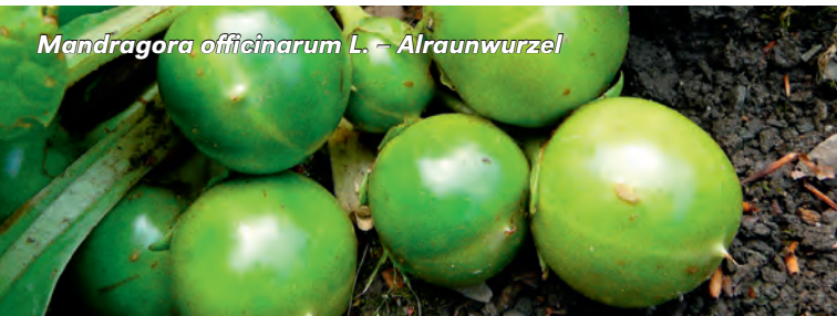
Mandragora officinarum L. – Alraunwurz

Ort: Gartenzimmer, Villa Eller, Elisenhöhe 1