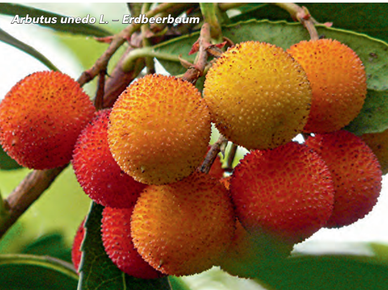
Arbutus unedo L. – Erdbeerbaum